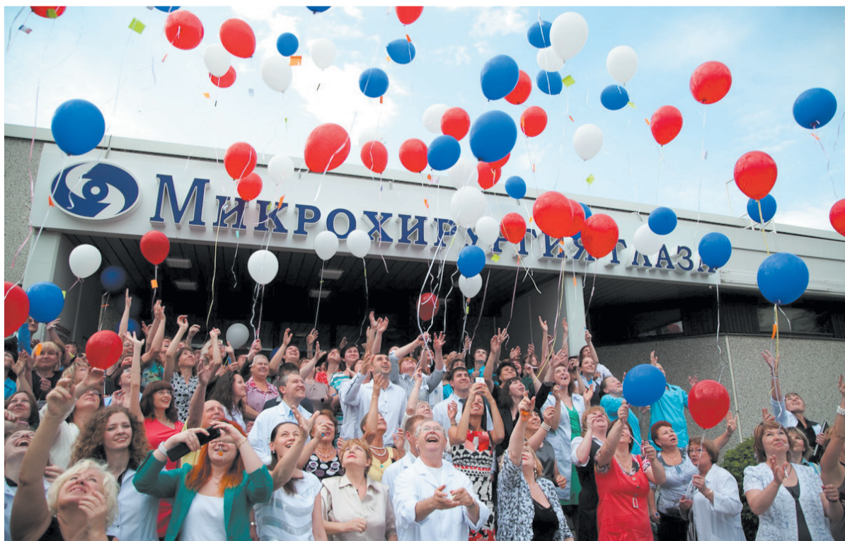
День медицинского работника — праздник всего коллектива.

Хотя, конечно, всегда есть те, кто спокойно почивает на лаврах. Мне не даёт это делать мой коллектив, который очень