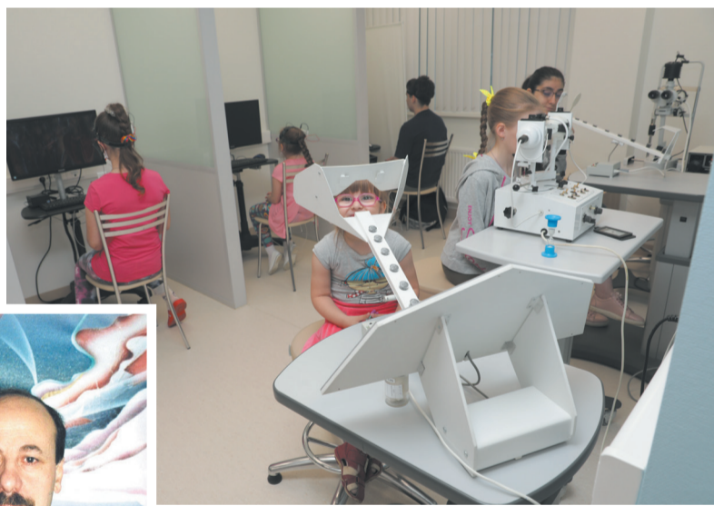
«Школа зрения» в детском отделении.